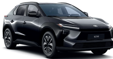
Attitude Black (218) 650 €