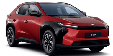
Emotional Red 2 (3U5) 950 €