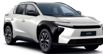
Platinum Pearl White (089) 950 €