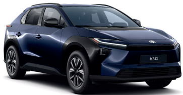
Dark Blue (8X8) 0 €