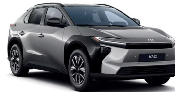
Deep Metal Grey (1L5) 950 €