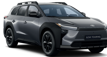
Magnetite Gray (D31) 650 €