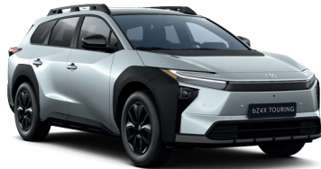
Ice Silver (D30) 650 €