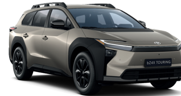
Brilliant Bronze (D35) 650 €