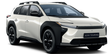
Crystal White (D29) 950 €