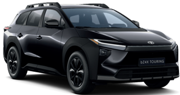
Crystal Black (D32) 0 €