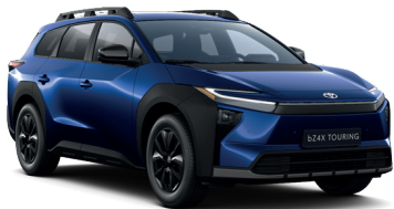
Sapphire Blue (D33) 950 €