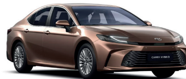
Bronze (4Y6) 950 €