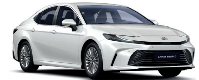
Platinum Pearl White (089) - 950 €