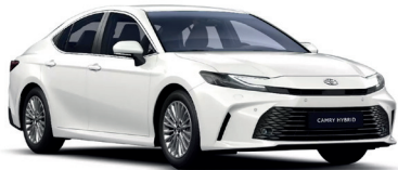
Pure White (040) 0 €