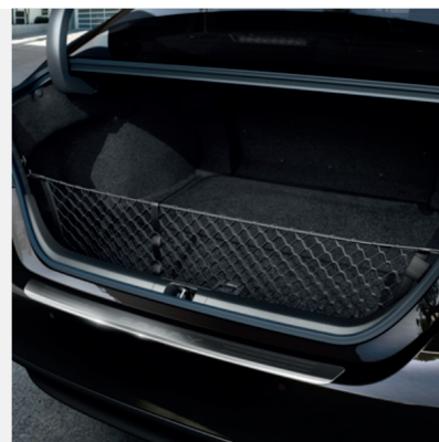
Krovinių tvirtinimo tinklėlis (vertikalus) Kaina - nuo 79€ Mėnesio įmoka nuo 1€/per mėnesį