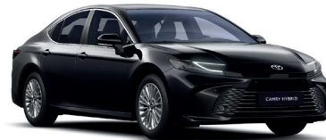
Attitude Black (218) - 650 €