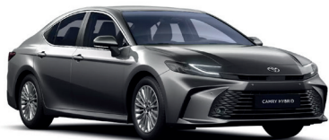
Deep Metal Grey (1L5) 950 €