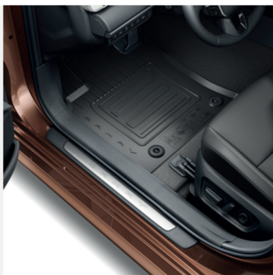
Guminiai grindų kilimėliai Kaina - nuo 184€ Mėnesio įmoka nuo 3€/per mėnesį