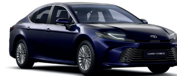
Dark Blue (8X8) - 650 €