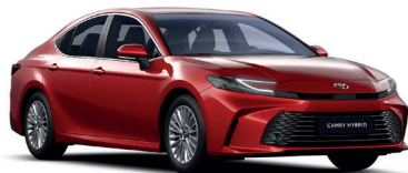
Emotional Red 3 (3U9) 950 €