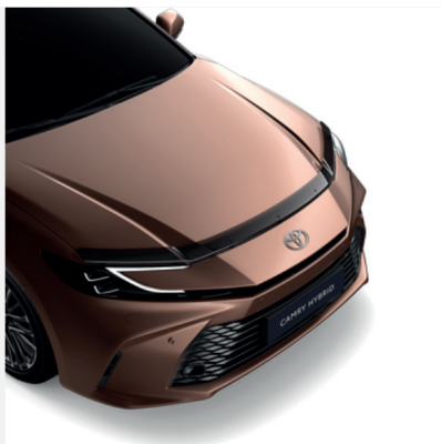
Variklio dangčio deflektorius Kaina - nuo 213€ Mėnesio įmoka nuo 3€/per mėnesį

METŲ GARANTIJA HIBRIDINIAM AKUMULIATORIUI