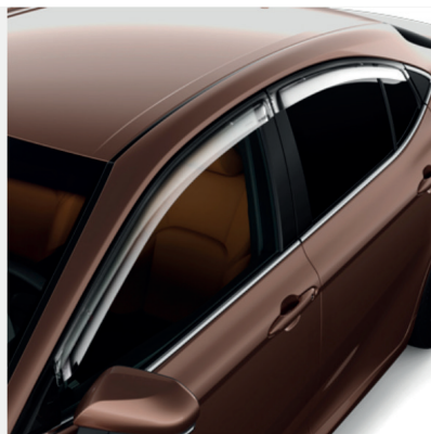
Vėjo deflektoriai (priekis ir galas) Kaina - nuo 397€ Mėnesio įmoka nuo 6€/per mėnesį