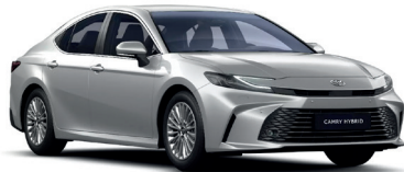
Ultra Silver (1F7) - 650 €