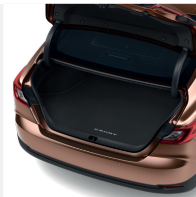
Tekstilinis bagažo kilimėlis Kaina - nuo 151€ Mėnesio įmoka nuo 2€/per mėnesį