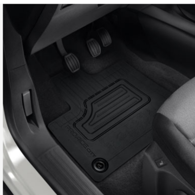
Guminiai grindų kilimėliai Kaina - nuo 78€ Mėnesio įmoka nuo 1€/per mėnesį