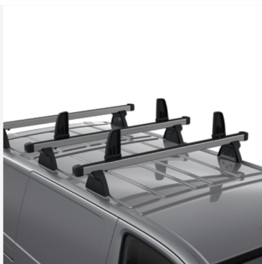
Krovinio sutvirtinimo prietaisas Kaina - nuo 100€ Mėnesio įmoka nuo 2€/per mėnesį