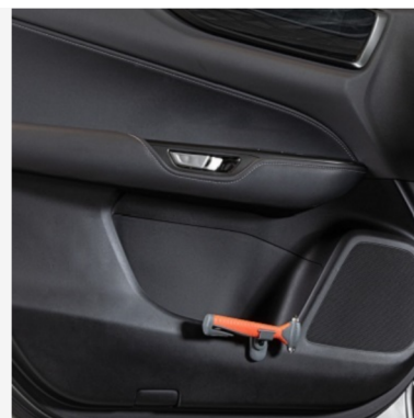
Avarinis plaktukas Kaina - nuo 34€ Mėnesio įmoka nuo 1€/per mėnesį