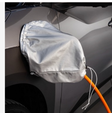
Įkrovimo lizdo dangtelis Kaina - nuo 47€ Mėnesio įmoka nuo 1€/per mėnesį

Į kainą įeina PVM ir montavimas, išskyrus žieminės padangas su lengvojo lydinio ratlankiais, kurių montavimo mokestis taikomas atskirai. Kainos skirtingose atstovybėse gali skirtis. Norėdami patikslinti dėl turimos papildomos įrangos ir kainų, kreipkitės į artimiausią Toyota atstovybę. Mėnesinė įmoka už papildomą įrangą galioja ją įsigyjant kartu su nauju automobiliu.