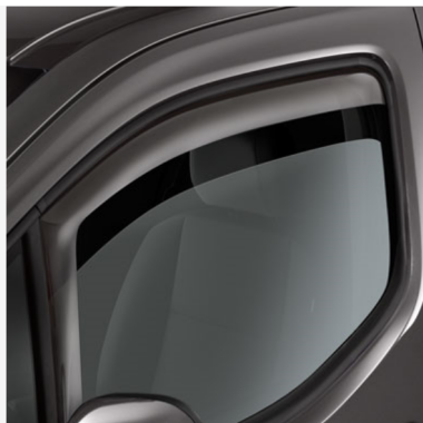
Vėjo deflektoriai Kaina - nuo 157€ Mėnesio įmoka nuo 2€/per mėnesį