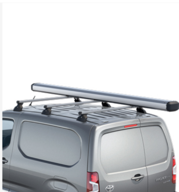
Stogo dėžė vamzdžiams gabenti Kaina - nuo 839€ Mėnesio įmoka nuo 13€/per mėnesį