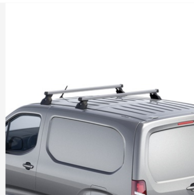
Stogo skersiniai laikikliai Kaina - nuo 325€ Mėnesio įmoka nuo 5€/per mėnesį