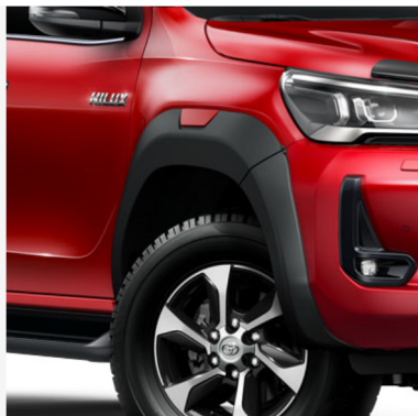
Sparnų apsauga su raudonu intarpu Kaina - nuo 512€ Mėnesio įmoka nuo 8€/per mėnesį