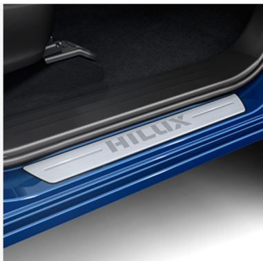
Aliumininės slenksčių plokštelės Kaina - nuo 245€ Mėnesio įmoka nuo 4€/per mėnesį