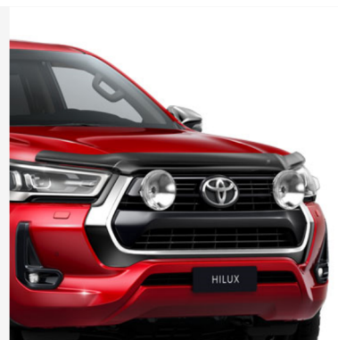
Papildomi tolimųjų šviesų žibintai Kaina - nuo 482€ Mėnesio įmoka nuo 7€/per mėnesį

Į kainą įeina PVM ir montavimas, išskyrus žieminės padangas su lengvojo lydinio ratlankiais, kurių montavimo mokestis taikomas atskirai. Kainos skirtingose atstovybėse gali skirtis. Norėdami patikslinti dėl turimos papildomos įrangos ir kainų, kreipkitės į artimiausią Toyota atstovybę. Mėnesinė įmoka už papildomą įrangą galioja ją įsigyjant kartu su nauju automobiliu.