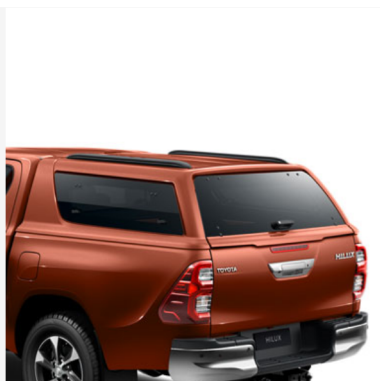
Laisvalaikiui skirtas kietas krovinių skyriaus dangtis Double Cab modeliui (Orange me (4R8)) Kaina - nuo 2757€