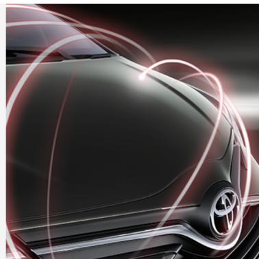
Ilgalaikė kėbulo apsauga Kaina - nuo 313€ Mėnesio įmoka nuo 5€/per mėnesį