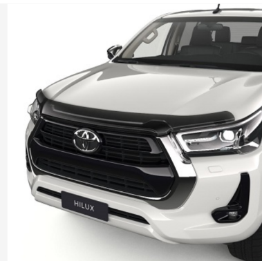
Variklio dangčio deflektorius Kaina - nuo 162€ Mėnesio įmoka nuo 2€/per mėnesį