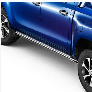
Šoniniai strypai Kaina - nuo 1046€ Mėnesio įmoka nuo 16€/per mėnesį