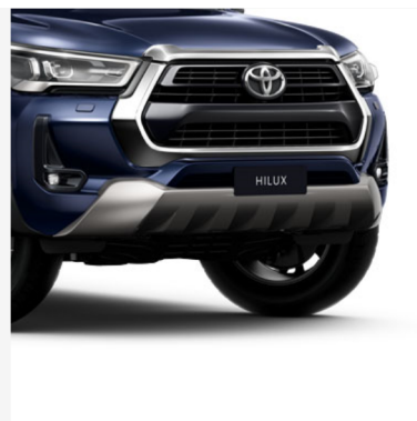
Apatinė apsauga priekyje Kaina - nuo 307€ Mėnesio įmoka nuo 5€/per mėnesį