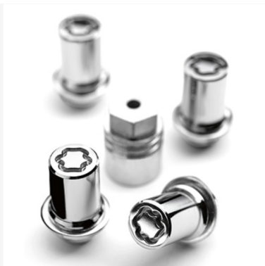
Rato užrakto varžtas