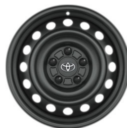
16 colių žieminiai ratlankiai