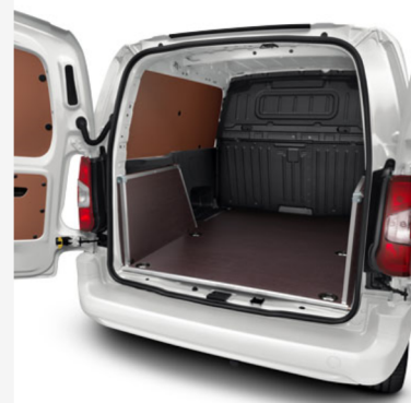
Medinės vidaus apdailos plokštės - lakuota medinė šoninė plokštė L2 su 2 slankiojamosiomis durelėmis