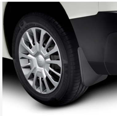
Galinių purvasaugių komplektas