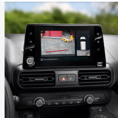
Galinė kamera, prijungta prie navigacijos sistemos