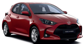
Emotional Red 2 (3U5) 700 €