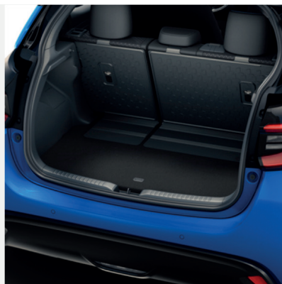
Sėdynės atlošo apsauga Kaina - nuo 112€ Mėnesio įmoka nuo 2€/per mėnesį