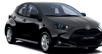
Night Sky Black (209) 470 €