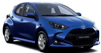
Juniper Blue (8Y8) 0 €