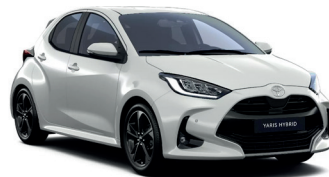
Bi-tone Platinum Pearl White/ Black (089/209) 1050 €