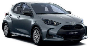
Celestite Grey (1K3) 470 €