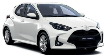
Pure White (040) 200 €