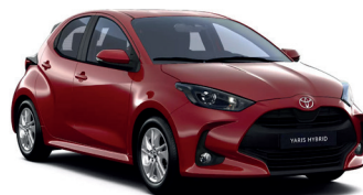
Emotional Red 2 (3U5) 700 €