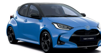
Bi-tone Neptune Blue (8T6/202) 820 €