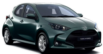
Forest Green (6X7) 470 €