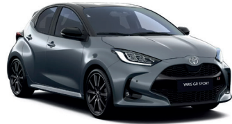
Bi-tone Celestite Grey (1K3/202) 470 €