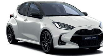
Bi-tone Platinum Pearl White (089/209) 700 €