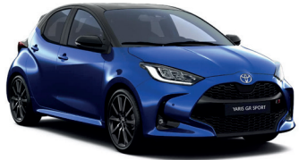
Bi-tone Juniper Blue (8Y8/202) 0 €