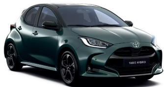
Bi-tone Forest Green (6X7/202) 820 €