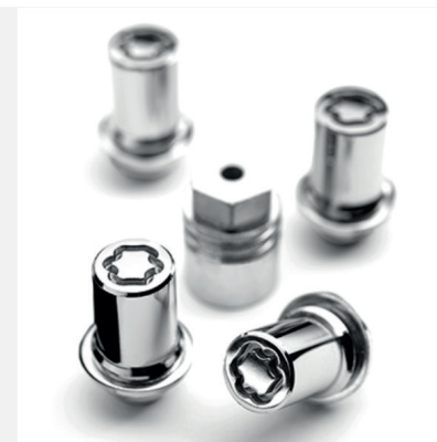
Rato užrakto veržlė Kaina - nuo 76€ Mėnesio įmoka nuo 1€/per mėnesį