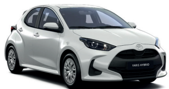
Platinum Pearl White (089) 700 €