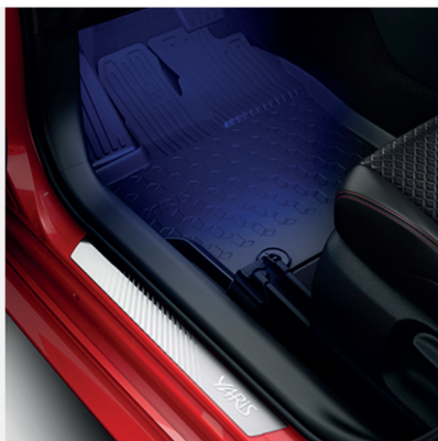
Guminiai grindų kilimėliai Kaina - nuo 108€ Mėnesio įmoka nuo 2€/per mėnesį

10 METŲ GARANTIJA HIBRIDINIAM AKUMULIATORIUI