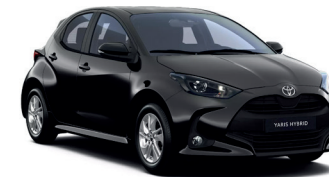
Night Sky Black (209) 470 €