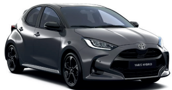
Bi-tone Storm Grey (1M2/202) 820 €