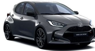
Bi-tone Storm Grey (1M2-202) 470 €