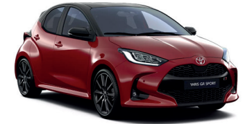
Bi-tone Emotional Red 2 (3U5/209) 700 €