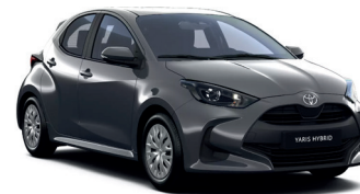
Storm Grey (1M2) 470 €