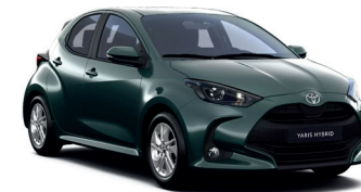
Forest Green (6X7) 470 €