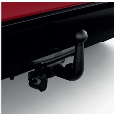
Nuimamas vilkimo kablys (horizontalus) Kaina - nuo 1240€ Mėnesio įmoka nuo 19€/per

Į kainą įeina PVM ir montavimas, išskyrus žieminės padangas su lengvojo lydinio ratlankiais, kurių montavimo mokestis taikomas atskirai. Kainos skirtingose atstovybėse gali skirtis. Norėdami pasitikslinti dėl turimos papildomos įrangos ir kainų, kreipkitės į artimiausią Toyota atstovybę. Mėnesinė įmoka už papildomą įrangą galioja ją įsigyjant kartu su nauju automobiliu.