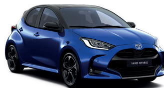
Bi-tone Juniper Blue (8Y8-202) 350 €