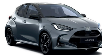
Bi-tone Celestite Grey (1K3/202) 820 €