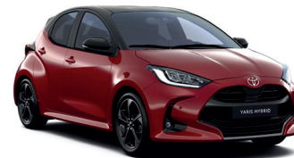
Bi-tone Emotional Red 2 3U5/209) 1050 €